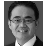
愛知県知事 大村 秀章氏

4歳からダンスを始め、高校からカナダに留学し、名門クウェンティンバレー工学校へ入学。「MISS UNIVERSE 2007」世界大会で優勝し世界一の栄冠に輝く。就任後はエイズ/HIVの啓蒙活動や難病の子供達への支援、社会問題など様々な活動に従事し14ヶ月をかけた15カ国を巡る。現在は「I.R.M. アカデミー」を開設し2〜70歳までの幅広い層へダンスを通しての子供育成や「一瞬では終わらない美」の指導にあたる。