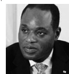
国際政治評論家 ムルアカ氏

金属深絞り加工の世界的職人として知られ、東京都墨田区の従業員数6人という小さな町工場でありながら、その高い技術力が日本はもちろん、世界の大企業やNASAなどに注目され、製品が次々に採用される実績を持つ。主な著書に「メシが食いたければ好きなことをやれ!!」(この書房、2008年9月)、「俺が、つくる!世界一の職人が語る仕事の哲学」(文庫、中経出版、2006年9月)など多数。