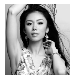
ミスユニバース 2007 森 理世氏

トラックの運転手から、材木屋としてブランドプロデューサーへ転進。デザイン・ファニチャーブランドSIKIなど数多くのライフスタイルショップを展開。海外でも中国初のデザイン・ギャラリーKOOを立ち上げ、中国国内のアート&デザインシーンに衝撃を与える。その活動はドイツの国営TVに取り上げられユーロ全域に発信され、イギリスで最も権威のあるデザイン誌ICON等にも取り上げられる。