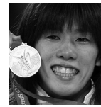
オリンピック 金メダリスト 吉田 沙保里氏